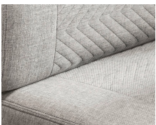
+ Wohnwelt Scandi