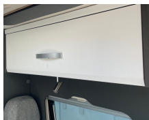
+ Möbeldekor Amberes Oak, Absatzdekor Trace Dark Grey